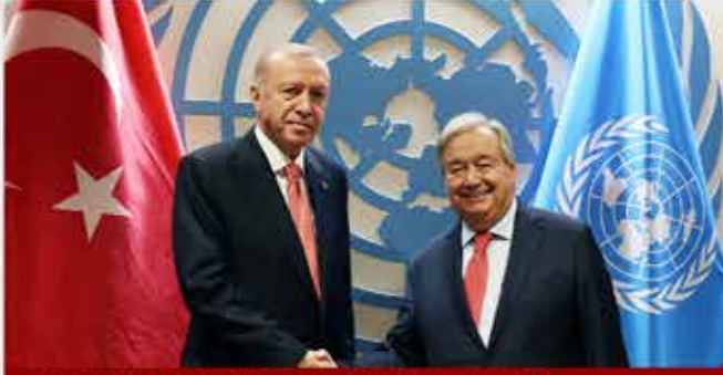
BİRLEŞMİŞ MİLLETLER (BM) GENEL SEKRETERİ ANTONIO GUTERRES