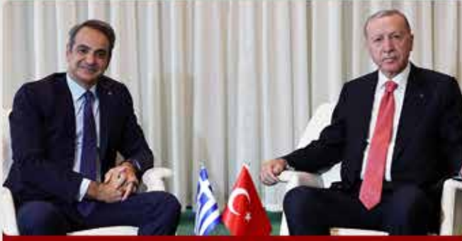
YUNANİSTAN BAŞBAKANI KİRİYAKOS MİÇOTAKİS