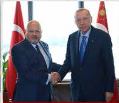
ULUSLARARASI CEZA MAHKEMESİ BAŞSAVCISI KARİM KHAM