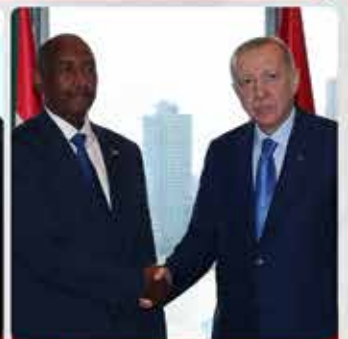
SUDAN EGEMENLİK KONSEYİ BAŞKANI ABDULFETTAH EL-BURHAN