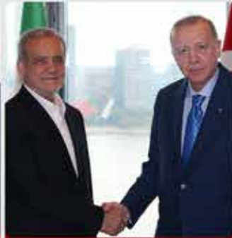
İRAN CUMHURBAŞKANI MESUT PEZEŞKİYAN