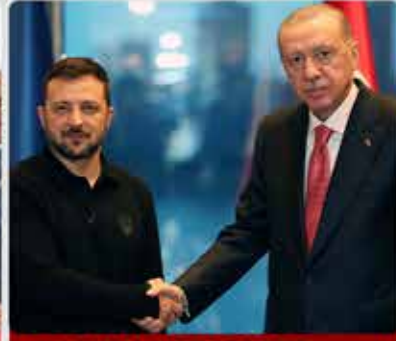
UKRAYNA DEVLET BAŞKANI VOLODİMİR ZELENSKİY