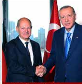
ALMANYA BAŞBAKANI OLAF SCHOLZ