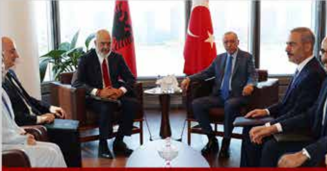
ARNAVUTLUK BAŞBAKANI EDİ RAMA