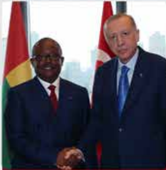
GİNE BİSSAU CUMHURBAŞKANI UMARO SİSSOCO EMBALO