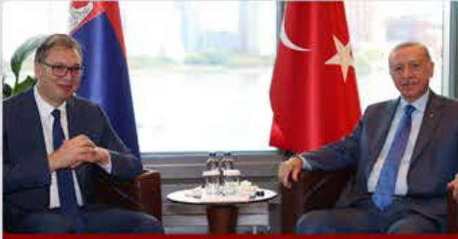
SIRBİSTAN CUMHURBAŞKANI ALEKSANDAR VUÇIĆ