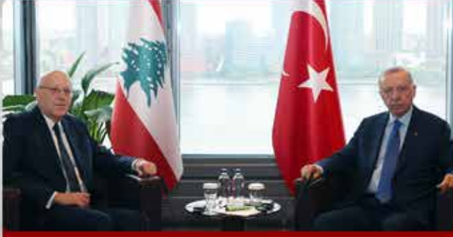
LÜBNAN BAŞBAKANI NECİB MİKATİ