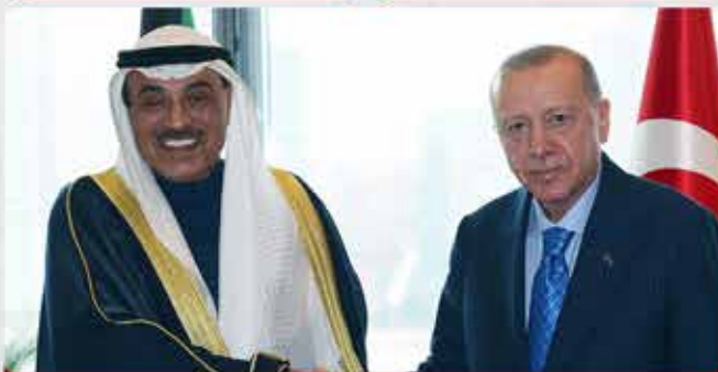
KUVEYT VELİAHT PRENSİ ŞEYH AL SABAH