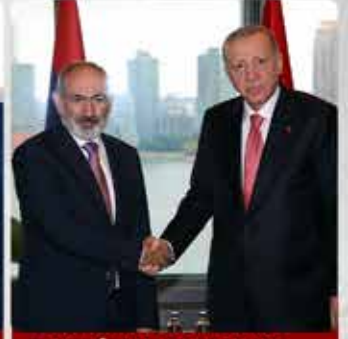
ERMENİSTAN BAŞBAKANI NİKOL PAŞINYAN