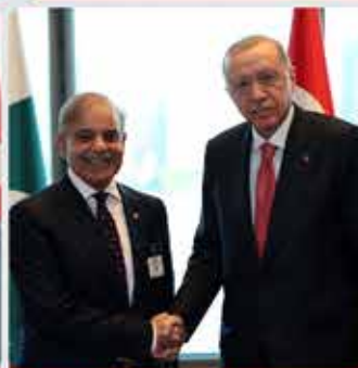
PAKİSTAN BAŞBAKANI ŞAHBAZ ŞERİF