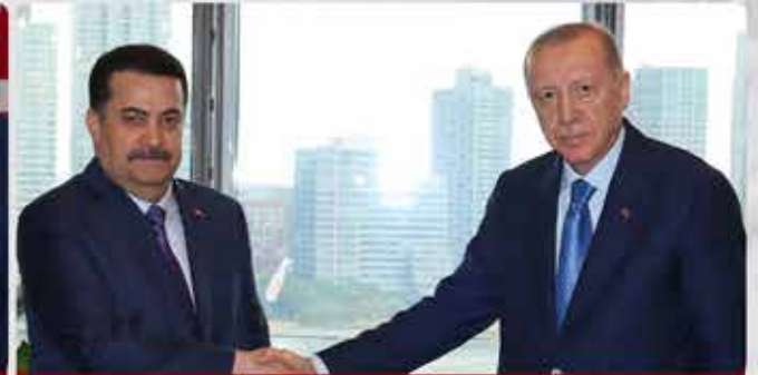
İRAK BAŞBAKANI MUHAMMED ŞİYA ES-SUDANI