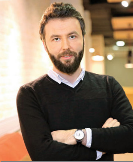
Mehmet Akif Ersoy Gazeteci-Yazar

Barzani tarafından hazırlıkları 2015 yılında başlayan ve 25 Eylül 2017'de yapılan bağımsızlık referandumu, IKBY yönetimini ve Irak'ı aşan bir anlam taşıyor.