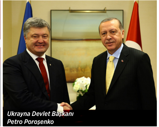
Ukrayna Devlet Başkanı Petro Porosenko