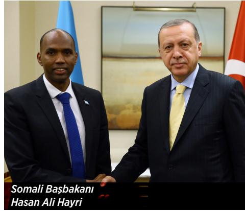
Somali Cumhurbaşkanı Hasan Ali Hayri