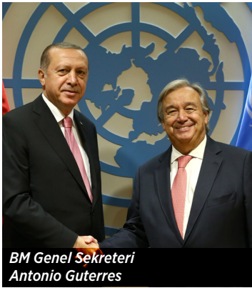
BM Genel Sekreteri Antonio Guterres