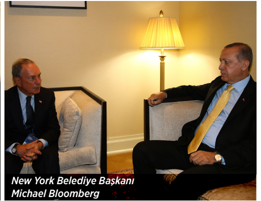
New York Belediye Başkanı Michael Bloomberg