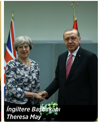
İngiltere Başbakanı Theresa May

sürgün etme yönündeki çabaları insanlık suçudur. DEAŞ'la mücadele meşru bir zeminde yürütülmediği takdirde, dünyanın yeni DEAŞ'ların tehdidi altına girmesi kaçınılmazdır.