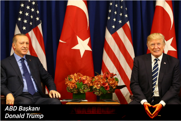
ABD Başkanı Donald Trump