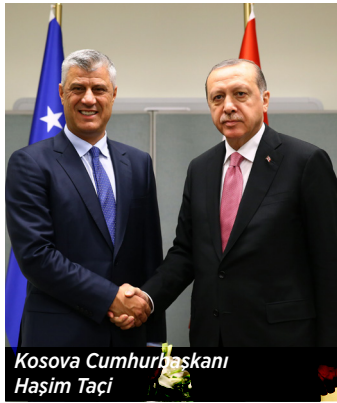
Kosova Cumhurbaşkanı Haşim Taçi