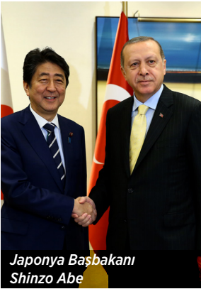
Japonya Başbakanı Shinzo Abe