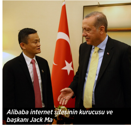
Alibaba internet sitesinin kurucusu ve başkanı Jack Ma