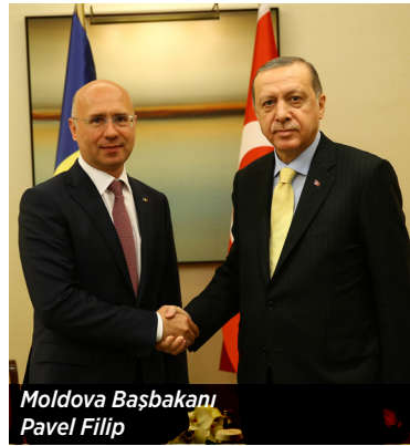
Moldova Cumhurbaşkanı Pavel Filip