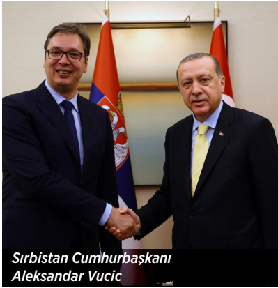
Sırbistan Cumhurbaşkanı Aleksandar Vučić