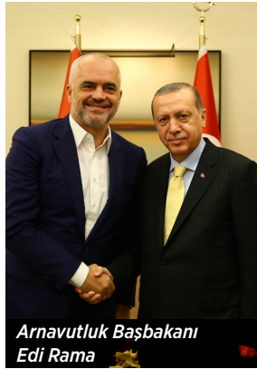
Arnavutluk Başbakanı Edi Rama