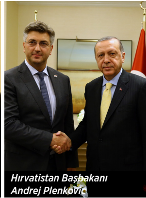
Hırvatistan Başbakanı Andrej Plenković