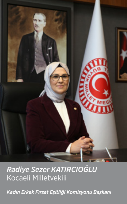
Radiye Sezer KATIRCIOĞLU Kocaeli Milletvekili

Kadın Erkek Fırsat Eşitliği Komisyonu Başkanı