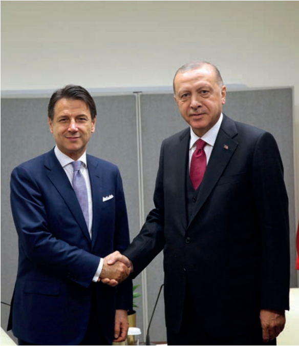
İtalya Başbakanı Giuseppe Conte