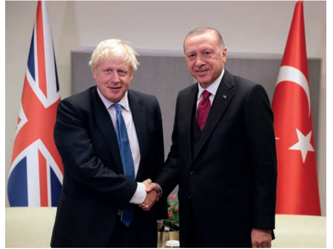
İngiltere Başbakanı Boris Johnson