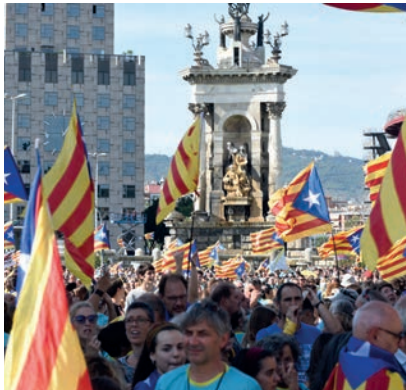
Katalonya'da Sular Tekrar Isınıyor