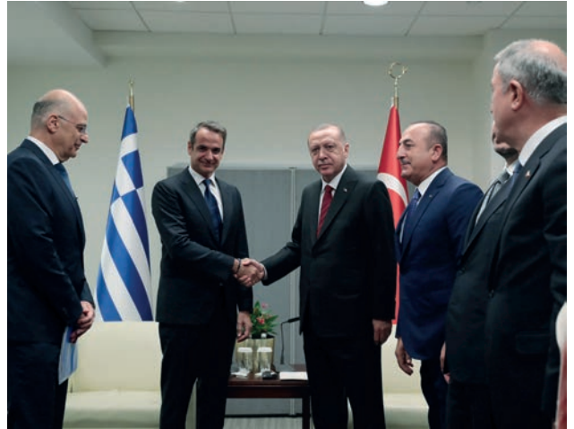
Yunanistan Başbakanı Kiriakos Miçotakis