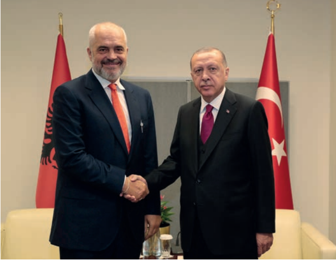
Arnavutluk Başbakanı Edi Rama