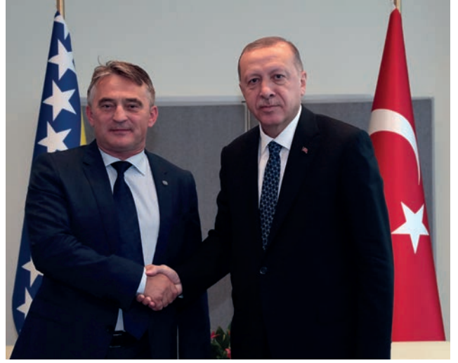
Başkanı Zeljko Komsic