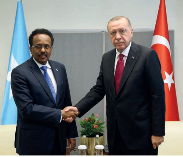
Somali Cumhurbaşkanı Muhammed Abdullah Muhammed Farmajo