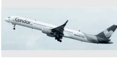
178 Yıllık Thomas Cook'un İflası