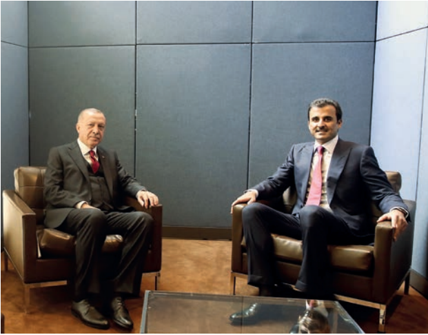
Katar Emiri Şeyh Temim bin Hamed Al Sani