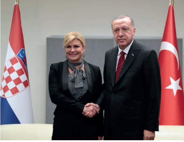
Hırvatistan Cumhurbaşkanı Kolinda Grabar Kitarović