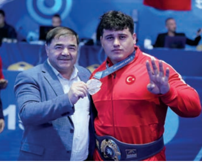
Rıza Kayaalp, 4. Kez Dünya Şampiyonu