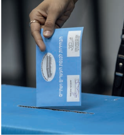
İsrail'de Seçim Yine Berabere Bitti