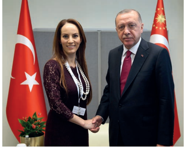
Parlamentolararası Birlik Başkanı Gabriela Cuevas Barroni.