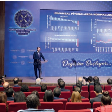
Yeni Ekonomi Programı Açıklandı