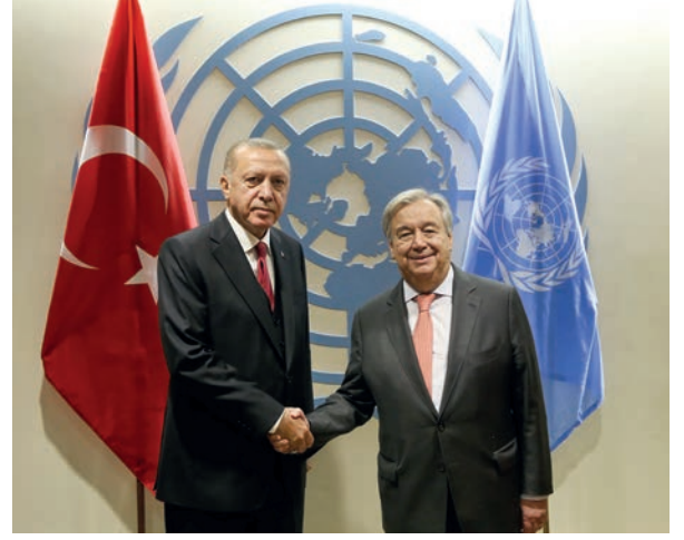
BM Genel Sekreteri Antonio Guterres