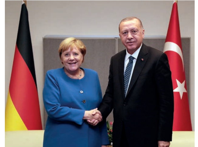
Almanya Başbakanı Angela Merkel