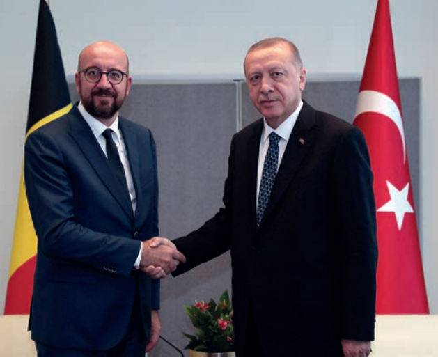
Cumhurbaşkanımız, New York'ta Belçika Başbakanı Charles Michel'i kabul etti.