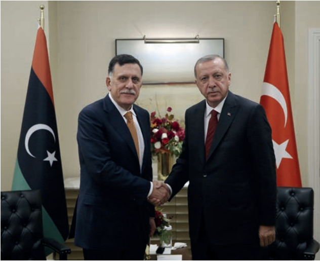
Libya Başkanlık Konseyi Başkanı Fayez Sarraj