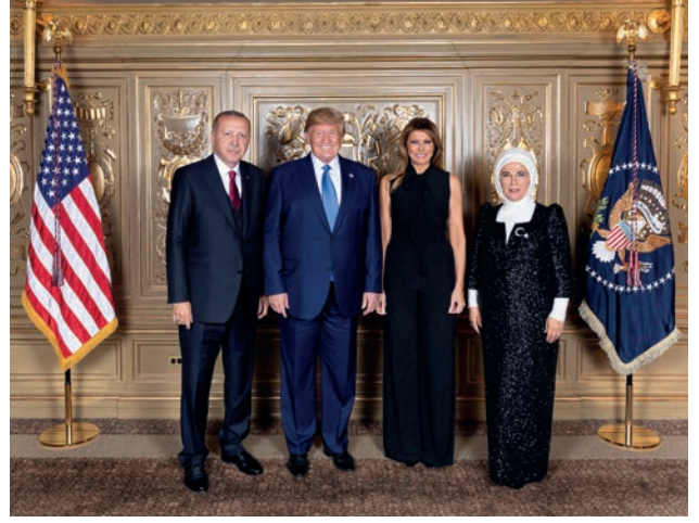
ABD Başkanı Donald Trump ve eşi Melania Trump