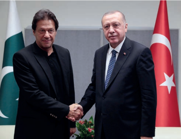
Pakistan Başbakanı İmran Han