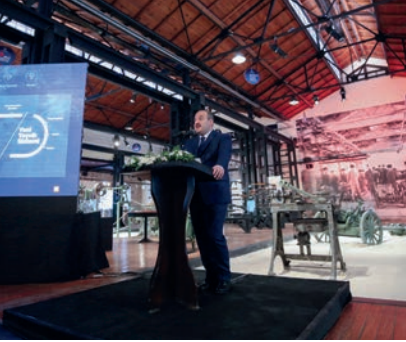
2023 Sanayi ve Teknoloji Stratejisi Açıklandı