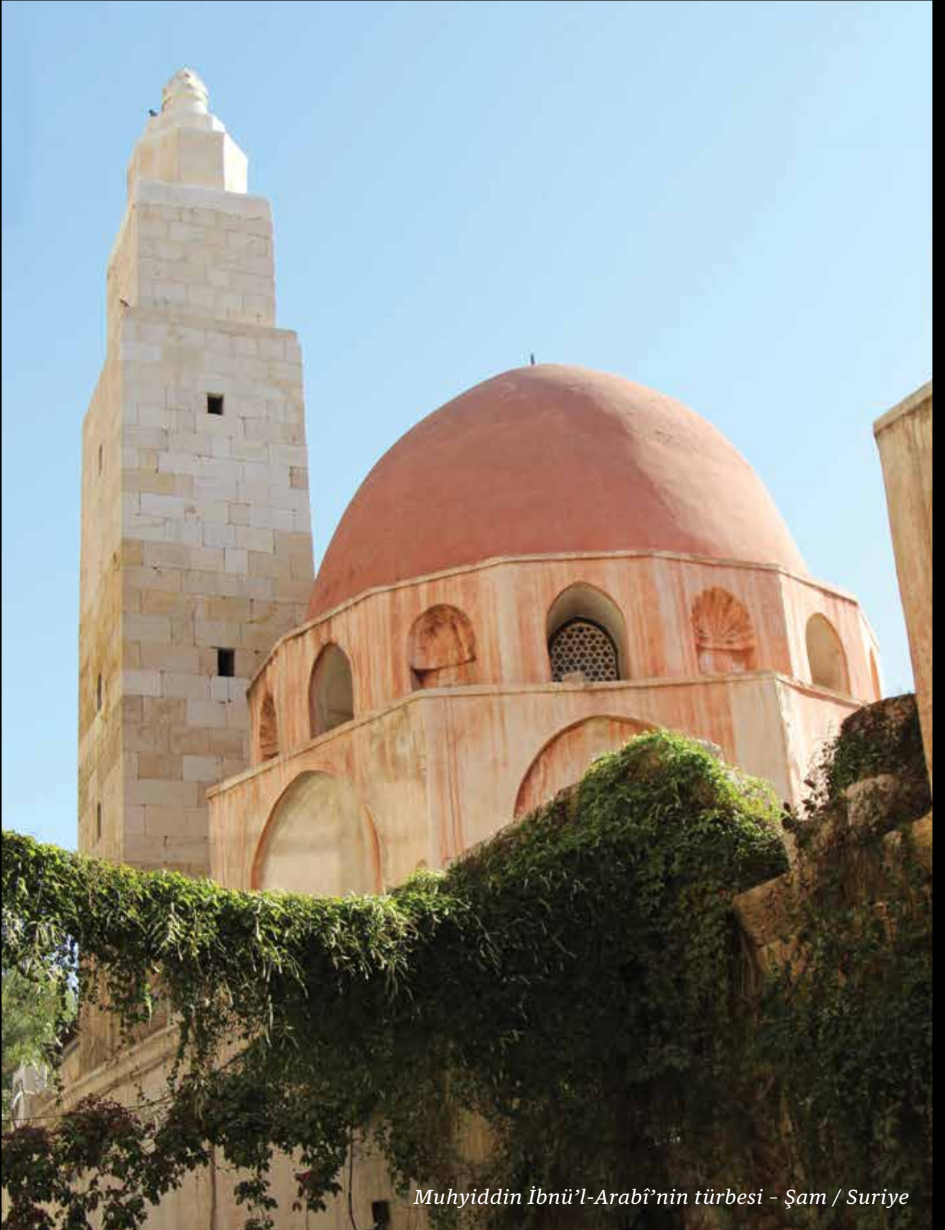
Muhyiddin İbnü'l-Arabî'nin türbesi - Şam / Suriye