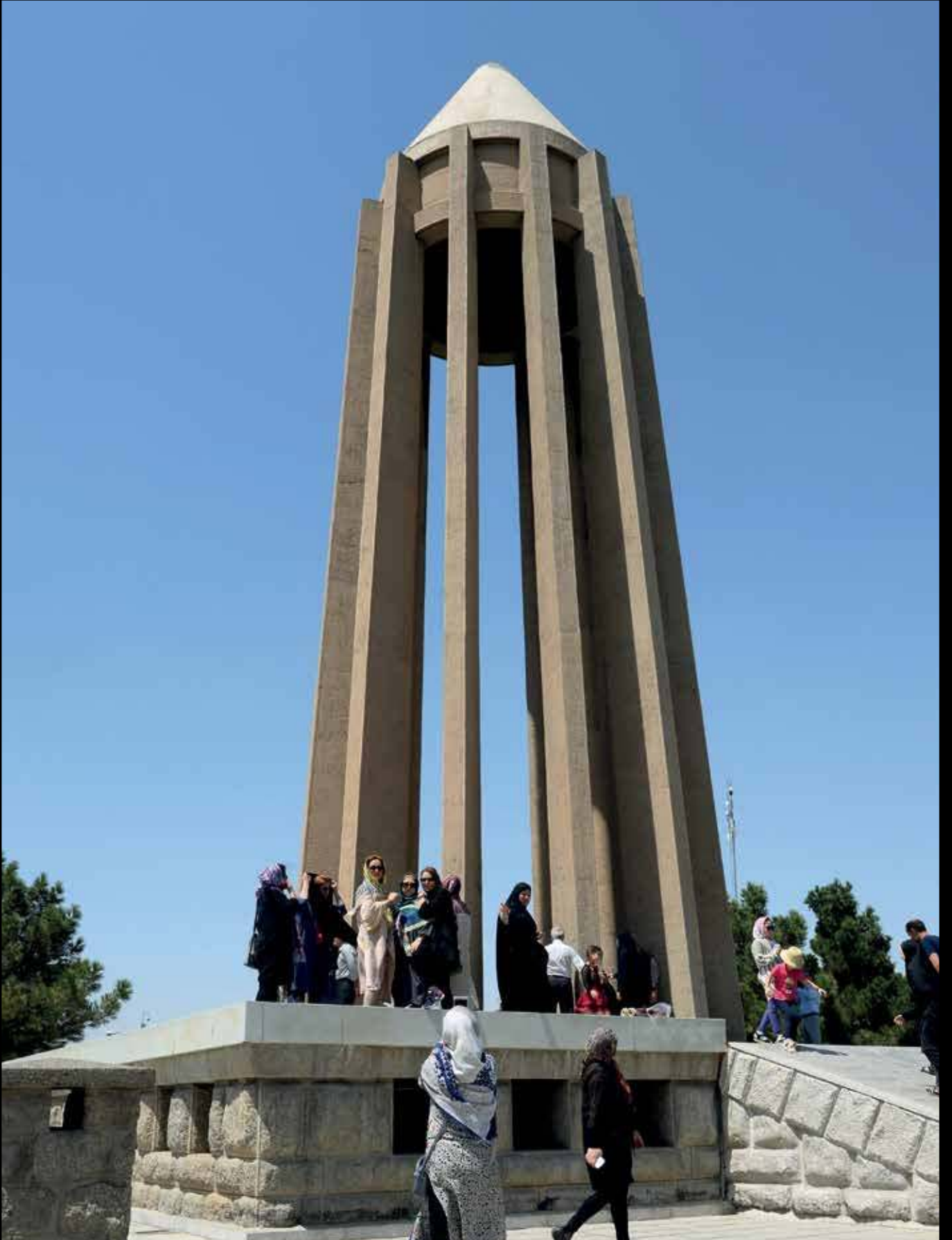
İran'ın Hemedan şehrinde bulunan İbni-i Sina'nın kabri.