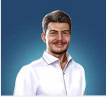
ABDULLAH TAYYİP OLÇOK