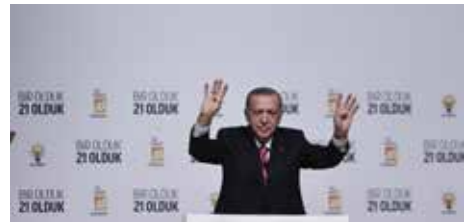
"AK Parti, 21 yıl önce siyaset sahnesine adım atmakla Türkiye'de yeni bir dönemi başlatmış, bu ülkeyi uçurumun eşiğinden kurtarmıştır"