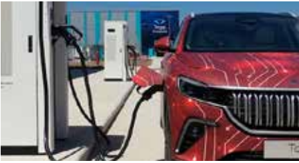
TOGG ilk kez şarjda görüntülendi