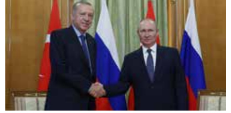
"Bu görüşme Türkiye ve Rusya'nın bölgede oynadığı rolü ortaya koyması bakımından çok önemli"