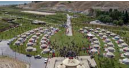
Ahlat Millet Bahçesi'nde "Malazgirt ruhu"