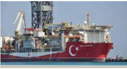
Abdülhamid Han sondaj gemisi göreve hazır