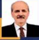
Numan KURTULMUŞ İstanbul Milletvekili