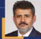
Ömer Oruç Bilal DEBGİCİ Kahramanmaraş Milletvekili