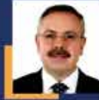
Halis DALKILIÇ İstanbul Milletvekili