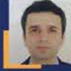
Mustafa KÖSE Antalya Milletvekili