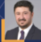
Emre ÇALIŞKAN Nevşehir Milletvekili