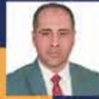
Ali KIRATLI Mersin Milletvekili