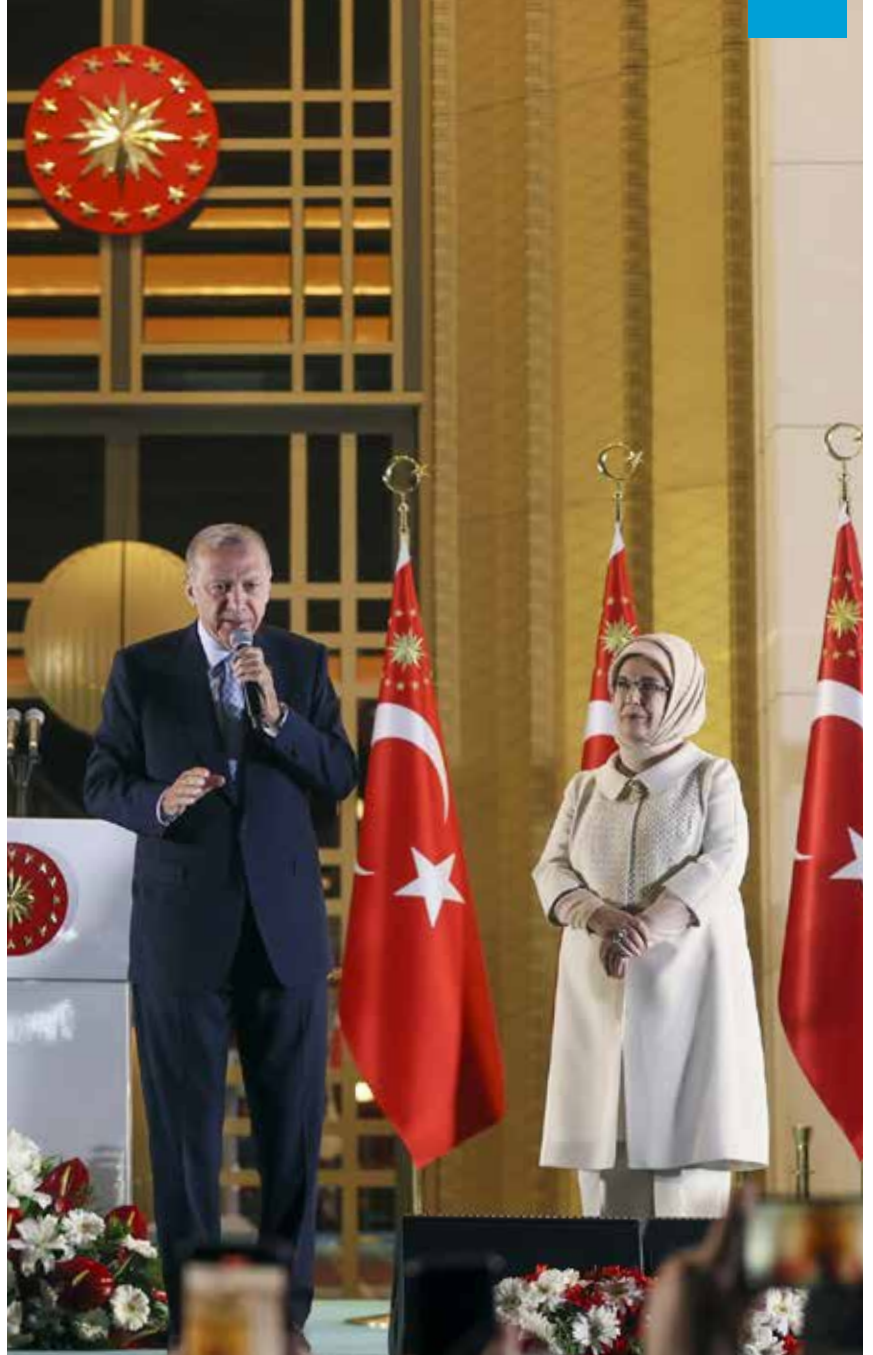
Cumhurbaşkanı Recep Tayyip Erdoğan 28 Mayıs'ta Cumhurbaşkanlığı Külliyesi'nde halka hitap etti