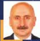
Adil KARAIŞMAİLOĞLU Trabzon Milletvekili