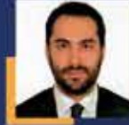
Ahmet Mücahit ARINÇ Manisa Milletvekili