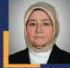
Tuba KÖKSAL Kahramanmaraş Milletvekili