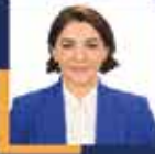
Şengül KARSLI İstanbul Milletvekili