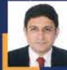
Zeki KORKUTATA Bingöl Milletvekili