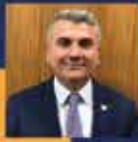
Mustafa CANBEY Balıkesir Milletvekili