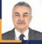
Mustafa SAVAŞ Aydın Milletvekili