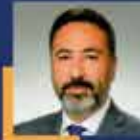
Mustafa Hakan ÖZER Konya Milletvekili