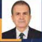
Ömer ÇELİK Adana Milletvekili