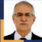
Muhammet Müfit AYDIN Bursa Milletvekili