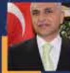
Mervan GÜL Siirt Milletvekili