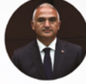
MEHMET NURİ ERSOY