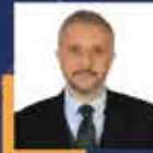
Adil BİÇER Kütahya Milletvekili