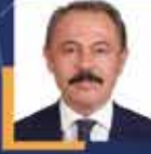
Şahin TİN Denizli Milletvekili