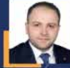
Kaan KOÇ Ardahan Milletvekili