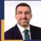
Adem ÇALKIN Kars Milletvekili