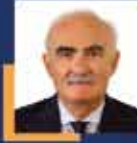
Yusuf Ziya YILMAZ Samsun Milletvekili