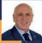
İsmail OK Balıkesir Milletvekili