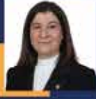
Fatma AKSAL Edirne Milletvekili