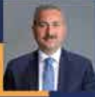
Abdülhamit GÜL Gaziantep Milletvekili