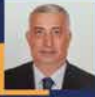
Vehbi KOÇ Trabzon Milletvekili