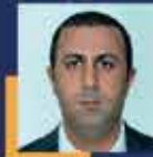
Turan BEDİRHANOĞLU Bitlis Milletvekili