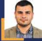
Eyyüp Kadir İNAN İzmir Milletvekili