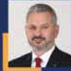
Hasan TURAN İstanbul Milletvekili