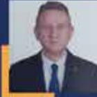
Mehmet DEMİR Kütahya Milletvekili