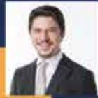
Selman ÖZBOYACI Konya Milletvekili