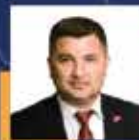
Ercan ÖZTÜRK Düzce Milletvekili