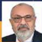
Yıldırım Tuğrul TÜRKEŞ Ankara Milletvekili