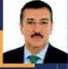
Bülent TÜFENKÇİ Malatya Milletvekili