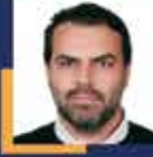
Gökhan DİKTAŞ Tekirdağ Milletvekili