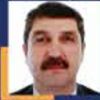
Ferhat NASIROĞLU Batman Milletvekili