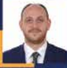
Ahmet BÜYÜKGÜMÜŞ Yalova Milletvekili