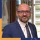
Adem KORKMAZ Burdur Milletvekili