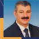
Hüseyin ALTINSOY Aksaray Milletvekili