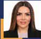
Behiye EKER İstanbul Milletvekili