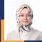
Zehranur AYDEMİR Ankara Milletvekili