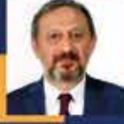
Mehmet Akif YILMAZ Kocaeli Milletvekili