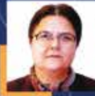
Derya YANIK Osmaniye Milletvekili