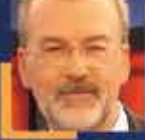
Mustafa Hulki CEVİZOĞLU İstanbul Milletvekili