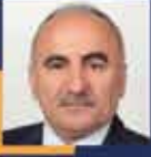
Harun MERTOĞLU Rize Milletvekili