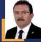
Selami ALTINOK Erzurum Milletvekili