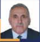
Ali İNCİ Sakarya Milletvekili