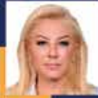
Şebnem BURSALI İzmir Milletvekili