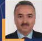
Ali TEMÜR Giresun Milletvekili