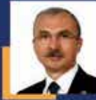
Orhan KIRCALI Samsun Milletvekili