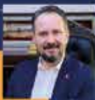
Mestan ÖZCAN Tekirdağ Milletvekili