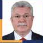
Muhammet Emin AKBAŞOĞLU Çankır Milletvekili