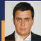
Osman GÖKÇEK Ankara Milletvekili