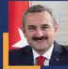
Bayram ŞENOCAK İstanbul Milletvekili