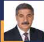
Azmi EKİNCİ İstanbul Milletvekili