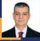
Erol KELEŞ Elazığ Milletvekili