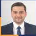
Mesut BOZATLI Gaziantep Milletvekili