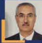
Feyzi BERDİBEK Bingöl Milletvekili