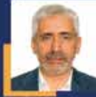
Mehmet Galip ENSARİOĞLU Diyarbakır Milletvekili