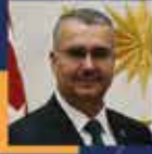
Yusuf AHLATCI Çorum Milletvekili