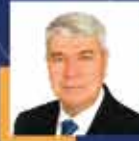
Seydi GÜLSOY Osmaniye Milletvekili