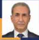
Abdürrahim DUSAK Şanlıurfa Milletvekili