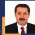
Faruk ÇELİK Artvin Milletvekili