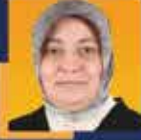
Yıldız KONAL SÜSLÜ İstanbul Milletvekili