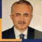
Yüksel COŞKUNYÜREK Bolu Milletvekili