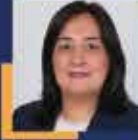
Emel GÖZÜKARA DURMAZ Bursa Milletvekili