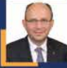
Mustafa YAVUZ Bursa Milletvekili