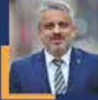
Ayhan SALMAN Bursa Milletvekili