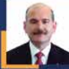
Süleyman SOYLU İstanbul Milletvekili