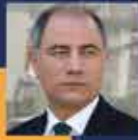
Efkan ALA Bursa Milletvekili