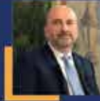
Oğuz ÜÇÜNCÜ İstanbul Milletvekili