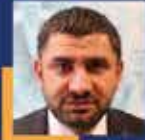
Yahya ÇELİK İstanbul Milletvekili