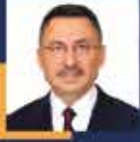
Fuat OKTAY Ankara Milletvekili