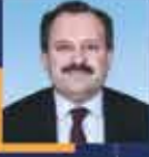
Halil ULUAY Kastamonu Milletvekili