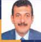
Muammer AVCI Zonguldak Milletvekili