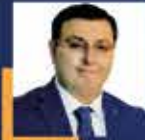
Serkan BAYRAM İstanbul Milletvekili