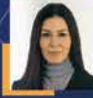
Çiğdem KARAASLAN Samsun Milletvekili