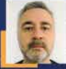
Ahmet Gökhan SARIÇAM Kırklareli Milletvekili