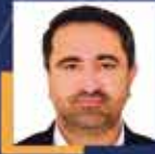
Serkan RAMANLI Batman Milletvekili