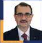
Fatih DÖNMEZ Eskişehir Milletvekili