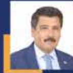
Kemal ÇELİK Antalya Milletvekili