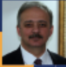
Kadem METE Muğla Milletvekili