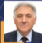
İbrahim Ufuk KAYNAK Ordu Milletvekili