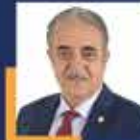
Hulusi ŞENTÜRK İstanbul Milletvekili