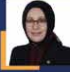
Çiğdem KONCAGÜL Tekirdağ Milletvekili