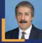
Abdurrahim FIRAT Erzurum Milletvekili