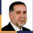
Ahmet ZENBİLCİ Adana Milletvekili