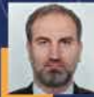
Mustafa ŞEN Trabzon Milletvekili