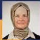
Meryem GÖKA Konya Milletvekili