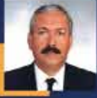
Kemal KARAHAN Hatay Milletvekili