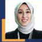
Rümeyza KADAK İstanbul Milletvekili