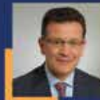
Atay USLU Antalya Milletvekili