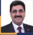
Hakan AKSU Sivas Milletvekili