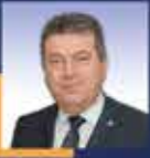
Ertuğrul KOCACIK Sakarya Milletvekili