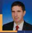
Orhan ATEŞ Bayburt Milletvekili