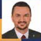
Mustafa OĞUZ Burdur Milletvekili