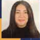
Ruken KILERCİ Ağrı Milletvekili