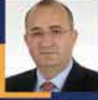
Ayhan GİDER Çanakkale Milletvekili