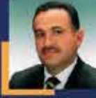
Hikmet BAŞAK Şanlıurfa Milletvekili