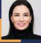
Seda SARIBAŞ Aydın Milletvekili