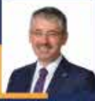
Şaban ÇOPUROĞLU Kayseri Milletvekili