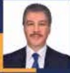
Cüneyt YÜKSEL İstanbul Milletvekili