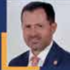
Ziya ALTUNYALDIZ Konya Milletvekili