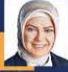
Ayşe BÖHÜRLER Kayseri Milletvekili