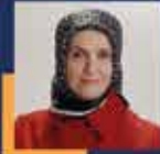
Ümmügülşen ÖZTÜRK İstanbul Milletvekili