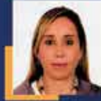
Tuba VURAL ÇOKAL Antalya Milletvekili