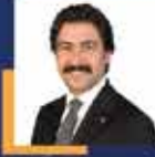
Cahit ÖZKAN Denizli Milletvekili