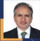
İsmail GÜNEŞ Uşak Milletvekili