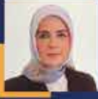
Büşra PAKER İstanbul Milletvekili