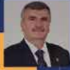
Tahir AKYÜREK Konya Milletvekili