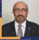
Ejder AÇIKKAPI Elazığ Milletvekili