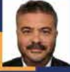
Ömer ÖZMEN Aydın Milletvekili