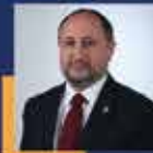
İsmail Emrah KARAYEL İstanbul Milletvekili