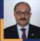
Osman MESTEN Bursa Milletvekili