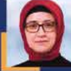
Rabia KALENDER İLHAN İstanbul Milletvekili