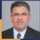
Faruk AYTEK Adana Milletvekili