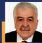
Şamil AYRIM İstanbul Milletvekili