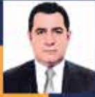
Bünyamin BOZGEYİK Gaziantep Milletvekili