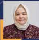
Ayşen GÜRCAN Eskişehir Milletvekili