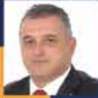
Hasan ÇİLEZ Amasya Milletvekili