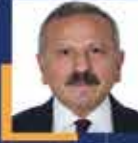
Yusuf BEYAZIT Tokat Milletvekili