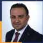
Murat BAYBATUR Manisa Milletvekili