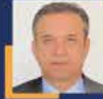
Mevlüt KURT Kahramanmaraş Milletvekili