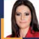
Jülide SARIEROĞLU Ankara Milletvekili