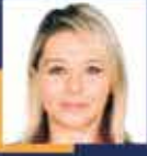
Fatma Serap EKMEKCI Kastamonu Milletvekili