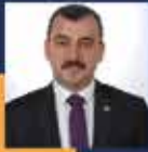
Ahmet ÇOLAKOĞLU Zonguldak Milletvekili