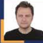
Halit YEREBAKAN İstanbul Milletvekili