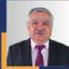
Latif SELVİ Konya Milletvekili