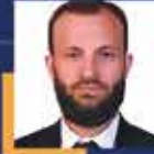
İsmail Çağlar BAYIRCI Kütahya Milletvekili