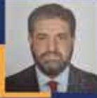
Abulkadir Emin ÖNEN Şanlıurfa Milletvekili