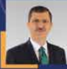
Mustafa ARSLAN Tokat Milletvekili