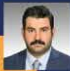
İbrahim EYYÜPOĞLU Şanlıurfa Milletvekili