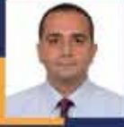
Sevan SIVACIOĞLU İstanbul Milletvekili