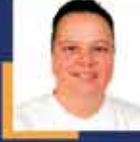
Nilgün ÖK Denizli Milletvekili