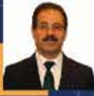
Abdulkadir AKGÜL Yozgat Milletvekili