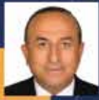
Antalya Milletvekili Mevlüt ÇAVUŞOĞLU Antalya Milletvekili