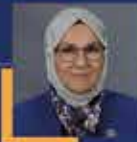
Radiye Sezer KATIRCIOĞLU Kocaeli Milletvekili