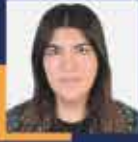
Derya AYAYDIN İstanbul Milletvekili