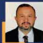
İbrahim Ethem TAŞ Antalya Milletvekili