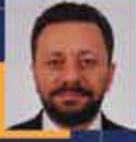
Muhammed AVCI Rize Milletvekili