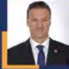
Fehmi Alpay ÖZALAN İzmir Milletvekili