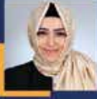
Sena Nur ÇELİK İstanbul Milletvekili