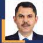
Murat KURUM İstanbul Milletvekili