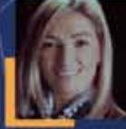
Fatma ÖNCÜ Erzurum Milletvekili