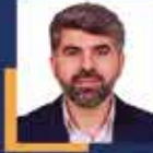
Faruk DİNÇ Mersin Milletvekili