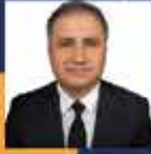
Saffet BOZKURT Zonguldak Milletvekili