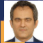
Mahmut ÖZER Ordu Milletvekili