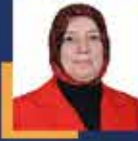
Emine YAVUZ GÖZGEÇ Bursa Milletvekili