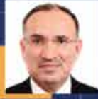
Bekir BOZDAĞ Şanlıurfa Milletvekili