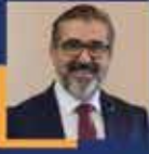
Adem YILDIRIM İstanbul Milletvekili