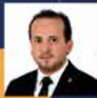
Refik ÖZEN Bursa Milletvekili