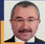
İsmail ERDEM İstanbul Milletvekili