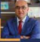
Murad Cahid CINGI Kayseri Milletvekili