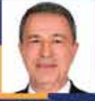
Hulusi AKAR Kayseri Milletvekili