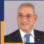
Mehmet Önder AKSAKAL İstanbul Milletvekili