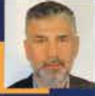
Yılmaz BÜYÜKAYDIN Trabzon Milletvekili