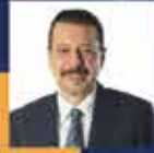
Mahmut Atilla KAYA İzmir Milletvekili