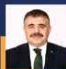
Veysel TİPİOĞLU Kocaeli Milletvekili