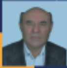
Yakup OTGÖZ Muğla Milletvekili