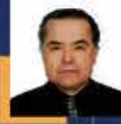
Cengiz AYDOĞDU Aksaray Milletvekili