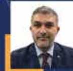
Adem YEŞİLDAL Hatay Milletvekili