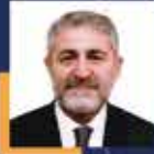
Nureddin NEBATİ Mersin Milletvekili