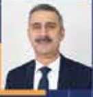
Lütfi BAYRAKTAR Sakarya Milletvekili