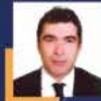
Cantürk ALAGÖZ İğdir Milletvekili