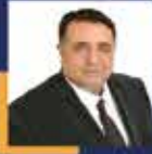
Oğuzhan KAYA Çorum Milletvekili