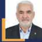
Zekeriya YAPICIOĞLU İstanbul Milletvekili