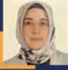
Özlem ZENGİN İstanbul Milletvekili