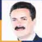
Haluk İPEK Amasya Milletvekili