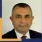
İhsan KOCA Malatya Milletvekili