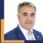
Abdullah AĞRALI Konya Milletvekili