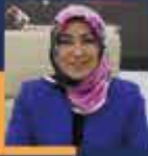
Rukiye TOY Sivas Milletvekili