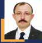
Mehmet MUŞ Samsun Milletvekili