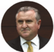
OSMAN AŞKIN BAK