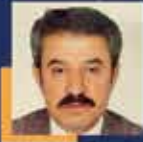
Aslan TATAR Şırnak Milletvekili