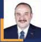
Mustafa VARANK Bursa Milletvekili