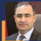
Hasan ARSLAN Afyonkarahisar Milletvekili