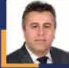
Nurettin ALAN İstanbul Milletvekili