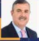
Nazım MAVİŞ Sinop Milletvekili