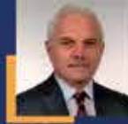
Nazım ELMAS Giresun Milletvekili