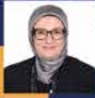
Belgin UYGUR Balıkesir Milletvekili