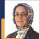
Lütfiye Selva ÇAM Ankara Milletvekili