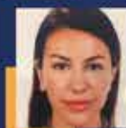
Nilhan AYAN İstanbul Milletvekili