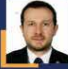
Ahmet KILIÇ Bursa Milletvekili