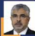
Ersan AKSU Samsun Milletvekili