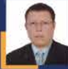
Fahrettin TUĞRUL Uşak Milletvekili