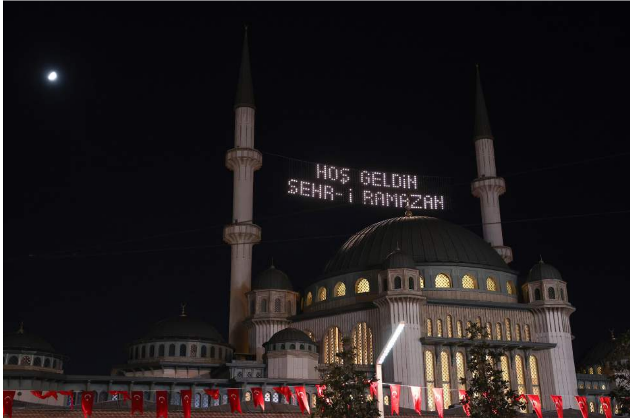
Taksim Camii'ne ilk kez ramazan mahyası asıldı.

Planlanan eserlerin bir bir gerçeğe dönüştürüldüğü bir Türkiye'yi meydana getirmek, ancak ve ancak bu uğurda aşk ile mücadele etmekle mümkündür. Aşk ile verilmeyen bir mücadele elbet deforme olacak, belki de esamesi okunmayacak bir mücadeledir. Partimizin kurucusu ve davamızın lideri Cumhurbaşkanımız Sayın Recep Tayyip Erdoğan'ın ise bu konuda nasıl bir irade ortaya koyduğunu ve nasıl bir rol model olduğunu bizler görüyoruz ve hepimiz buna şahidiz. Cumhurbaşkanımızın yorulmak bilmeyen karakteri ve azmi, elbette Türkiye'ye olan aşkıdan ileri gelmektedir. Partimiz ve bizler de aynı aşk ile, yorulmak bilmeden hedeflerimize doğru ilerlemeyi sürdüreceğiz. AK Parti, dün olduğu gibi bugün ve yarın da Cumhurbaşkanımızın açtığı istikamette yürümeye, hatta aşk ile koşmaya devam edecektir. Çünkü biz bilmekteyiz ki: “Aşkından Koşan Yorulmaz...”